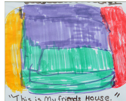
Tim Yoisten This is My friends House 2010 12 x 16 inches Colour pen on Paper