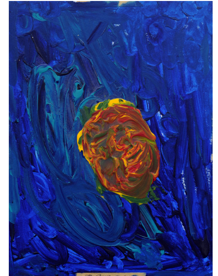
Jim Cassidy Untitled 2004 15 x 11 inches Acrylic on Board Collection of Lucie Hanak