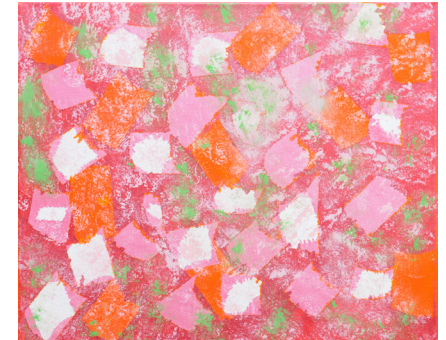
Lorrie Evershed and Paulette Audette Untitled 2007 16 x 20 inches Tempera on Paper