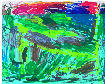
Glory McMorrow Clouds 2009 17 x 21 inches Tempera on Paper