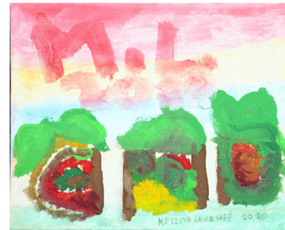
Melissa Lavallee The Three Houses 2010 10 x 12 inches Acrylic on Canvas

Fondée en 1991 par un petit groupe de personnes ayant un intérêt pour l'Arche, l'Arche London compte maintenant 3 foyers : Cana, Jubilee et Bethany. Il y a 12 membres de cœur qui sont au centre de la communauté et partagent leur vie avec plusieurs assistants demeurant en foyer. On y trouve un programme de jour dans lequel les membres de cœur peuvent exprimer leur créativité et offrir leur participation dans la collectivité.