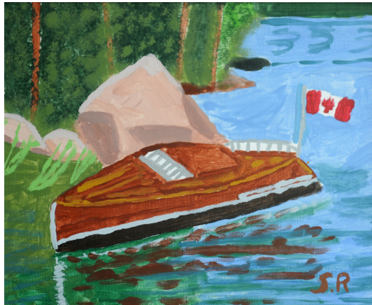
Stephen Richardson Boat 22 x 24 inches Acrylic on Canvas