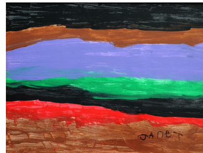
Janet Blair Untitled 2010 12 x 15 inches Acrylic on Paper